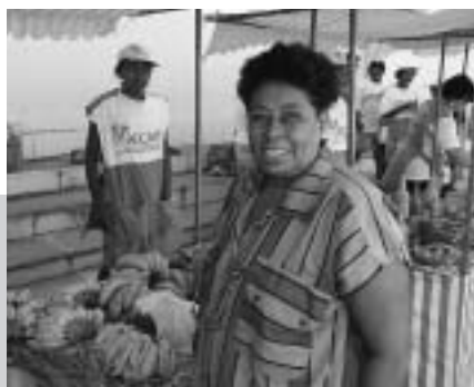
Frauen der Landarbeiterinnengewerkschaft MMTR vermarkten ihr Biogemüse in Eigenregie