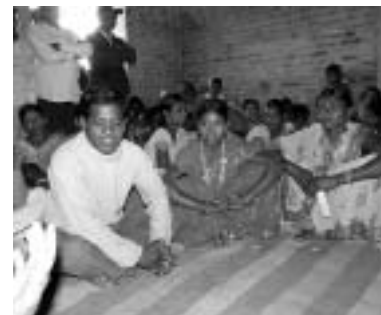
Frauen und Männer einer Bürgerinitiative gegen Zwangsheirat und Frauenhandel. DARPAN, Jharkhand

In Indien unterstützen wir Partnerorganisationen in den fünf Bundesstaaten Bihar, Jharkhand, Orissa, Andhra Pradesh und Tamil Nadu.