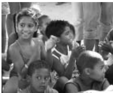
Lesestunde in der multikulturellen Kinder- und Jugendbibliothek NASCEDOURO

In Brasilien unterstützen wir Partnerorganisationen in den nördlichen und nordöstlichen Bundesstaaten.