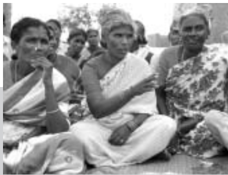
Ohne Männer wird unbefangener diskutiert. Frauenselbsthilfegruppe bei PAS, Andhra Pradesh