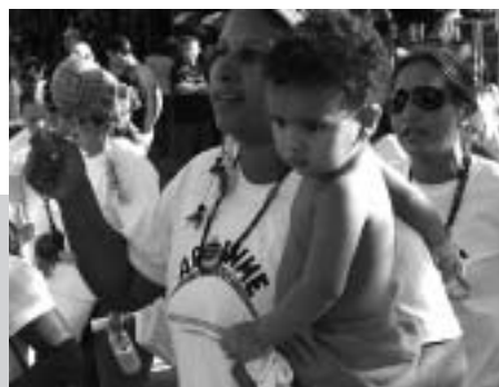
Protestaktion des Indigenen-Netzwerkes APOINME