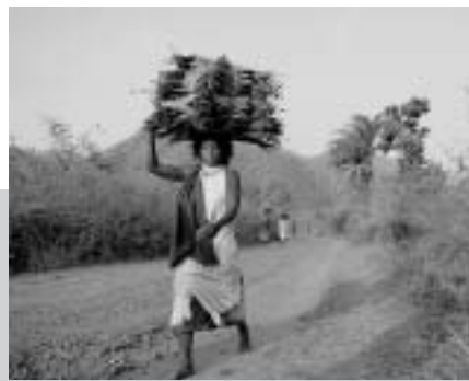
Frauen der Adivasi-Gemeinschaft der Dongria Kondh. FARR, Orissa.