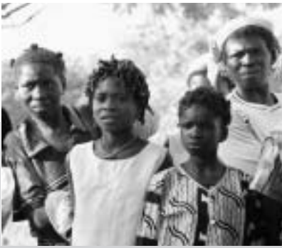
Das ganze Dorf verfolgt die Aufklärungsaktionen gegen weibliche Genitalverstümmelung. APFG, Burkina Faso