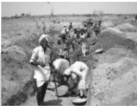
Dammbau für besseres Wassermanagement. REDS, Andhra Pradesh