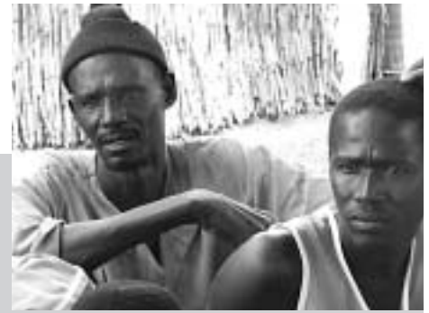
Männer eines Dorfkomitees diskutieren Möglichkeiten der Bodenverbesserung. AJEF, Senegal