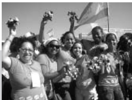
„Marcha das Margaridas“ – Protestmarsch der Landfrauen in die Hauptstadt Brasília