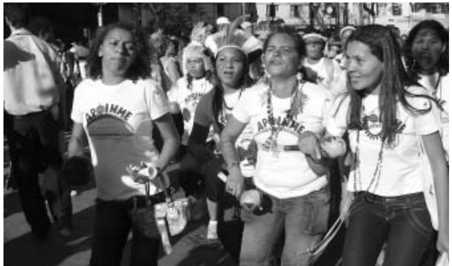
Kreativer Protest: Frauen unserer brasilianischen Partnerorganisation APOINME fordern mehr Rechte für indigene Gruppen

Die regelmäßigen Projektbesuche unserer LänderreferentInnen dienen dazu, zu schauen, ob die Partner im Sinne ihrer ei-