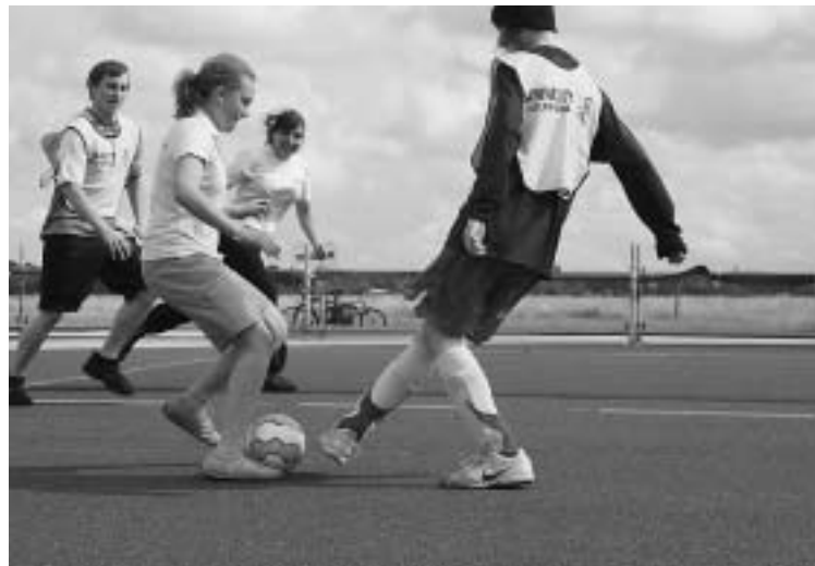
Fußballfestival Strasselkickt Open 2011 in Berlin: 10 Schulteams des ASW-Bildungsprojektes waren dabei. Aber auch die ASW kickte mit: hier gegen das Team von amnesty.