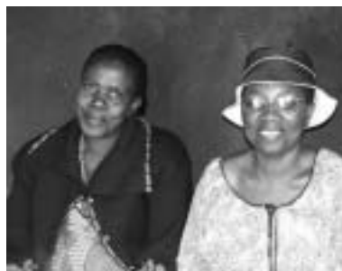
Nach einem Workshop zu Ernährung und HIV. CEPHAC, Simbabwe