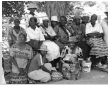
Bäuerinnen bei DABANE, Simbabwe, unterstützen sich gegenseitig mit der Weitergabe von Saatgut.